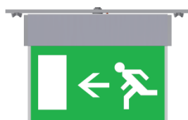
Pictograma Diretiva 92/58/CEE

O QLELEL deve ser alimentado numa fase específica e diferente da fase dos aparelhos de iluminação.