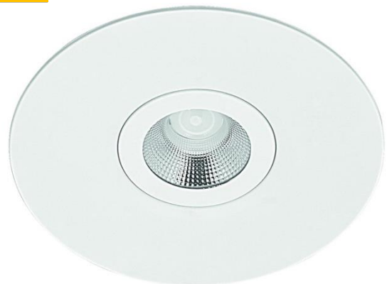
DRLM100 + KIT - ARO DRL N°3 T9016