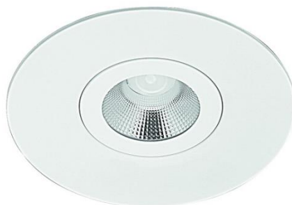
DRLM100 + KIT - ARO DRL N°2 T9016