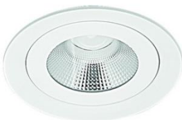
DRLM100 + KIT - ARO DRL N°1 T9016