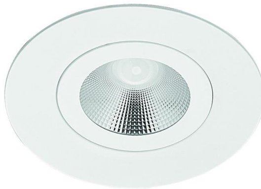
DRLM100 + KIT - ARO DRL N°5 T9016