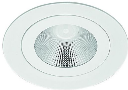
DRLM100 + KIT - ARO DRL N°4 T9016